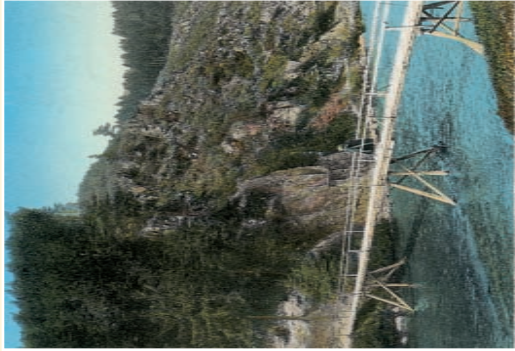
Partie a. Hingroy turlettoho stesby most Semily a Zel. Brodum