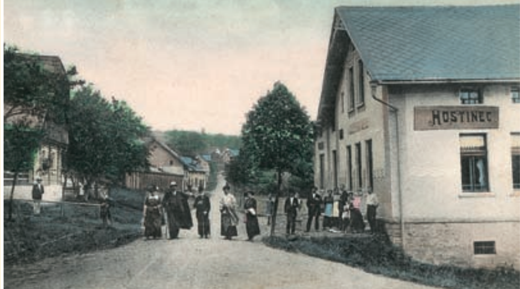
Kousalova restaurace v Bytouchově na Riegrově turistické stezce.