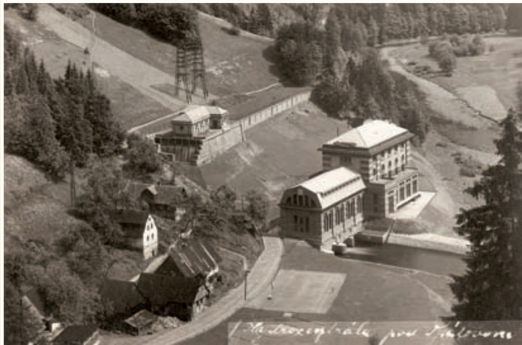
Hydroelectric power station