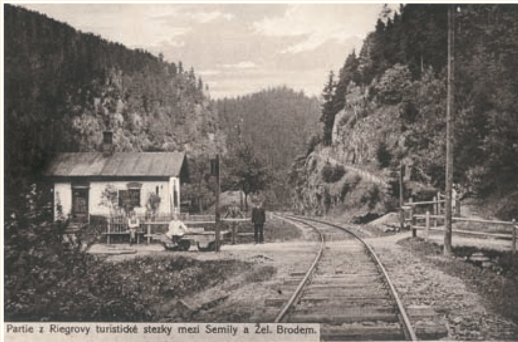
Partie z Riegrovy turistické stezky mezi Semily a Žel. Brodem.