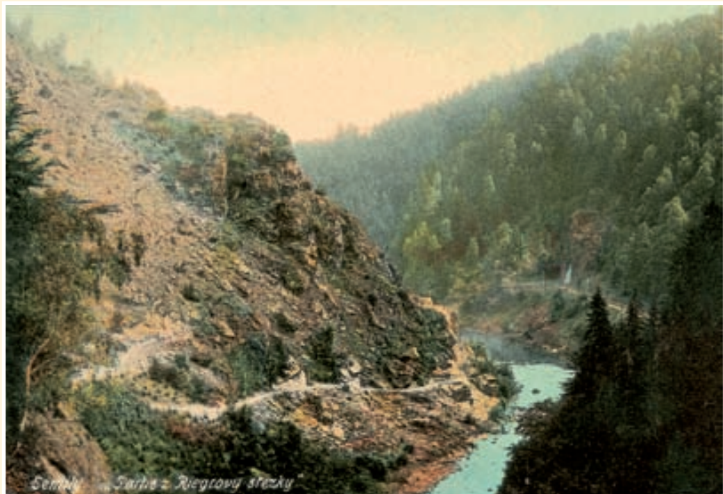
Semily - Jarho - Riegrovy stezky