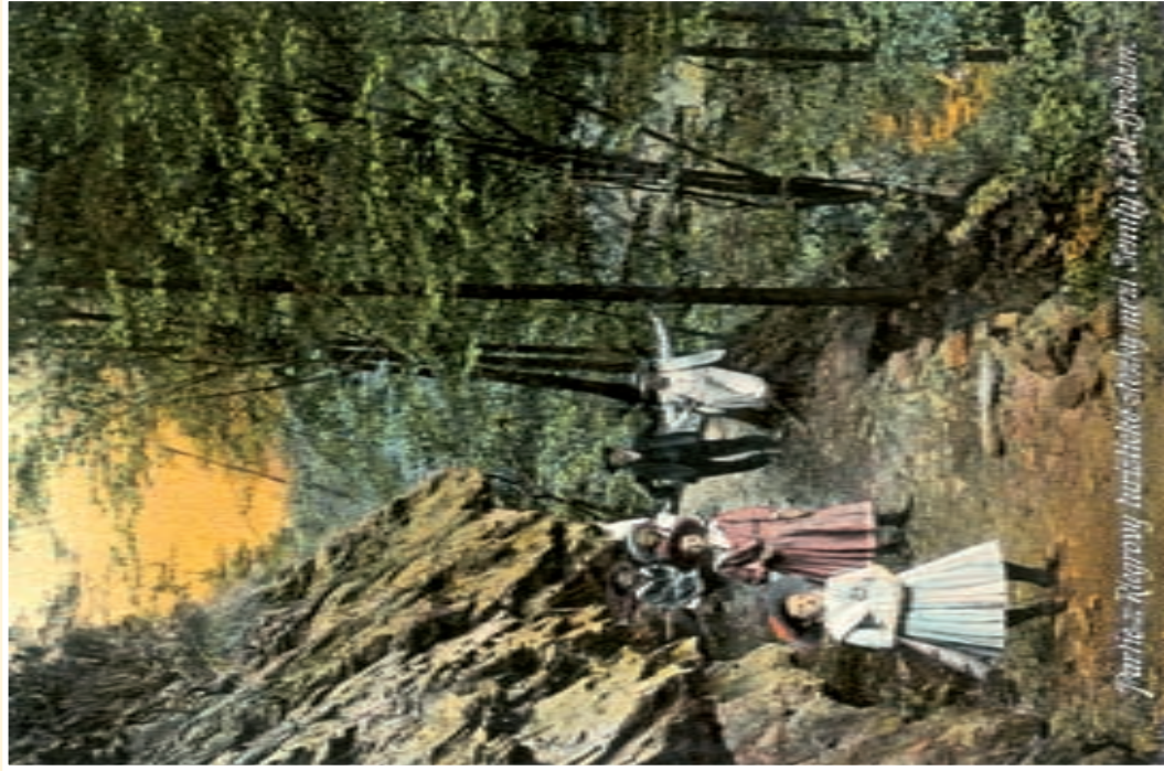
Partie - Rogrovy turistické stredisko medzi Senilou a Ľad-Drogom.